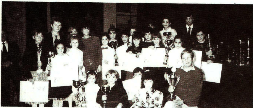
MASSA - I fisarmonicisti, i chitarristi e gli organisti primi classificati alla 2 a rassegna nazionale "Città di Massa".

è il numero del Conto Corrente Postale intestato a STRUMENTI E MUSICA per inviare la quota di L. 30.000 e rinnovare l'abbonamento per il 1989